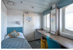
Standard Single Cabin Deck 3, 4 & 5, Einzelbett, Fenster oder Bullauge