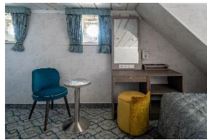
Superior Twin Cabin Deck 3 & 4 Twin Betten Bullauge