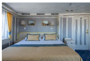
Owner's Suite mit privatem Umlauf Deck 6 Doppelbett Große Fenster & Privater Umlauf