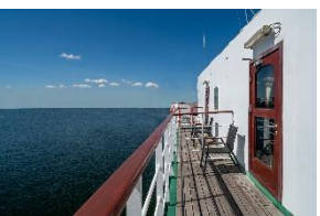
Executive Suite mit Balkon Deck 7 Doppelbett Privater Balkon