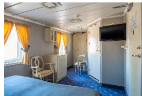
Deluxe Double Cabin Deck 4, 5 & 6 Doppelbett Große Fenster