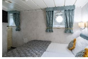
Standard Double Cabin Deck 3 Doppelbett Bullauge