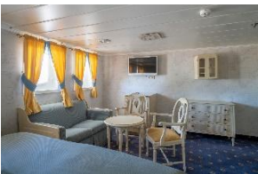
Junior Suite Deck 6 Doppelbett Große Fenster