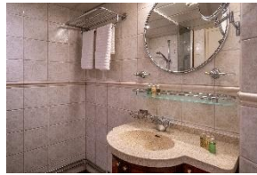
Standard Twin Cabin Deck 3 Twin Betten Bullauge