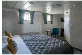
Superior Double Cabin Deck 4 Doppelbetten Bullauge