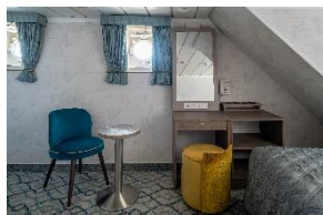
Superior Twin Cabin Deck 3 & 4 to enkeltseng køye