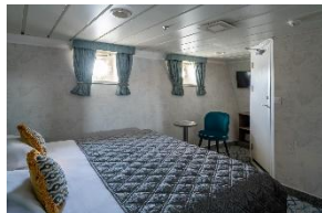
Superior Double Cabin Deck 4 dobbeltseng køye