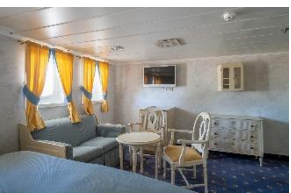
Junior Suite Deck 6 dobbeltseng store vinduer