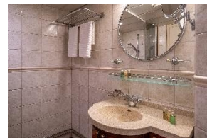
Standard Twin Cabin Deck 3 to enkeltsenger køye