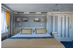
Owner's Suite with private walkway Deck 6 dobbeltseng store vinduer & privat Walkway