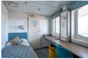
Standard Single Cabin Deck 3, 4 & 5, enkeltseng, vinduer eller køye