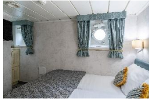
Standard Double Cabin Deck 3 dobbeltseng køye