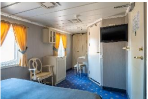
Deluxe Double Cabin Deck 4, 5 & 6 dobbeltseng store vinduer