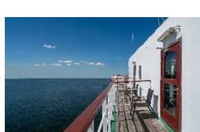
Executive Suite with Balcony Deck 7 dobbeltseng privat balkon